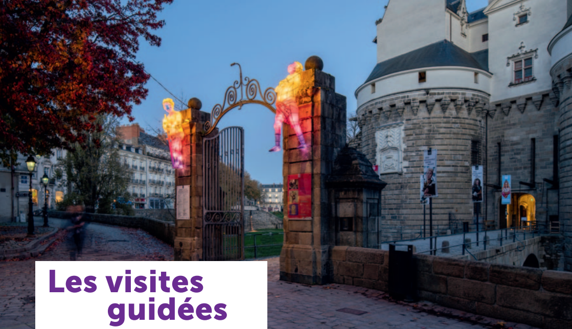
La nuit je vois, Vincent Olinet