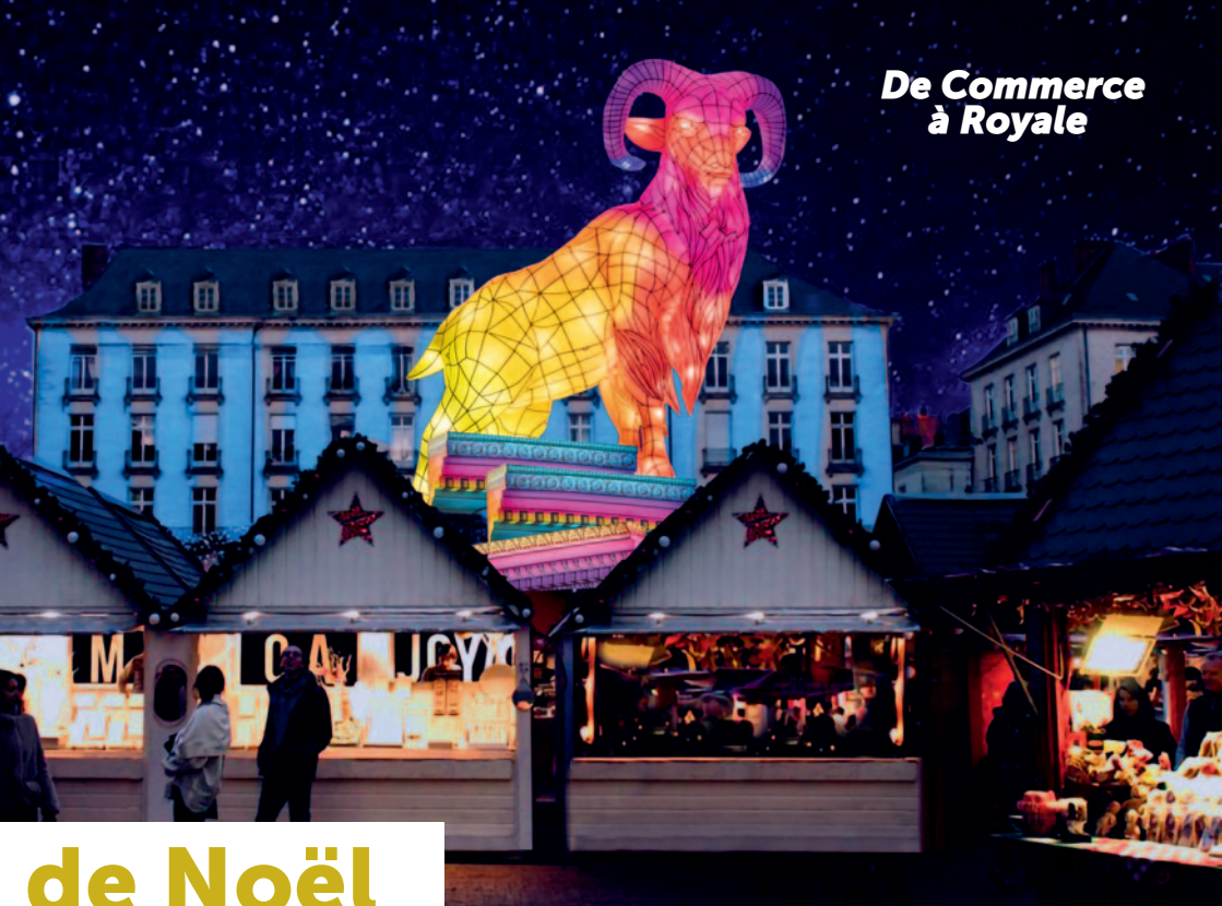
La nuit je vois, Vincent Olinet. Esquisse