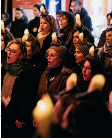
Le Voyage en hiver 2023, Chorale Y Birds x Le Voyage à Nantes